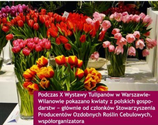
Podczas X Wystawy Tulipanów w Warszawie-Wilanowie pokazano kwiaty z polskich gospodarstw – głównie od członków Stowarzyszenia Producentów Ozdobnych Roślin Cebulowych, współorganizatora