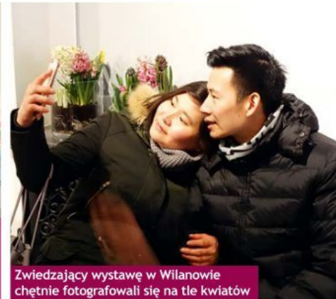
Zwiedzający wystawę w Wilanowie chętnie fotografowali się na tle kwiatów