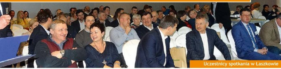
Uczestnicy spotkania w Łaskowie